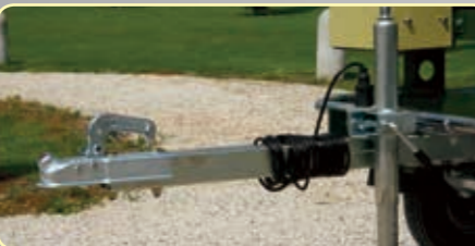
Timone fisso Fixed drawbar Timon fixe Timón fijo Feste Deichsel Vaste dissel Неподвижное дышло