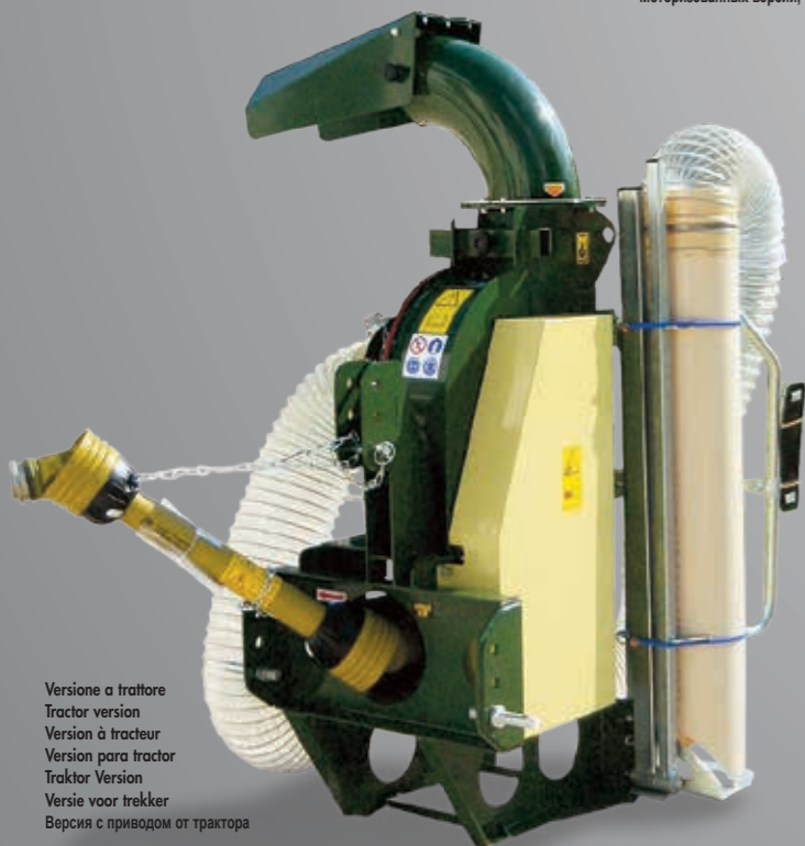
Versione a trattore Tractor version Version à tracteur Version para tractor Traktor Version Versie voor trekker Версия с приводом от трактора

Versione a motore con carrello omologato / Engine version with homologated street carriage / Version motorisée avec essieu routier homologué / Versión con motor con remolque de carretera homologada / Versión mit Motor mit zugelassenem Straßenfahrwerk / Versie met motor en gehomologeerde aanhanger / Моторизованных версий, колесное шасси с правом выезда на автодороги общего пользования