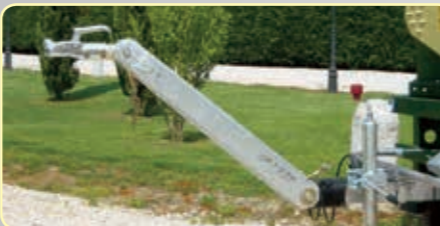
Timone regolabile in altezza Drawbar with adjustable height Timon réglable en hauteur Timón regulable en altura Höhenverstellbare Deichsel Regelbare dissel in hoogte Регулируемое по высоте дышло

Versione a motore con carrello omologato / Engine version with homologated street carriage / Version motorisée avec essieu routier homologué / Versión con motor con remolque de carretera homologada / Versión mit Motor mit zugelassenem Straßenfahrwerk / Versie met motor en gehomologeerde aanhanger / Моторизованных версий, колесное шасси с правом выезда на автодороги общего пользования