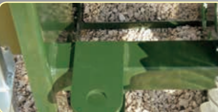
Attacco per rimorchi Connection for trailers Attache pour remorques Enganche para remolque Zugöse für Anhänger Aankoppeling voor aanhangers Крепление для буксирования

Alle versies zijn gebouwd in overeenstemming met de nieuwste veiligheidsnormen die van kracht zijn.