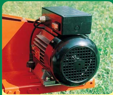
MOTORE ELETTRICO 3 E CV - 220 / 380 V