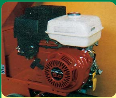
HONDA 9 CV